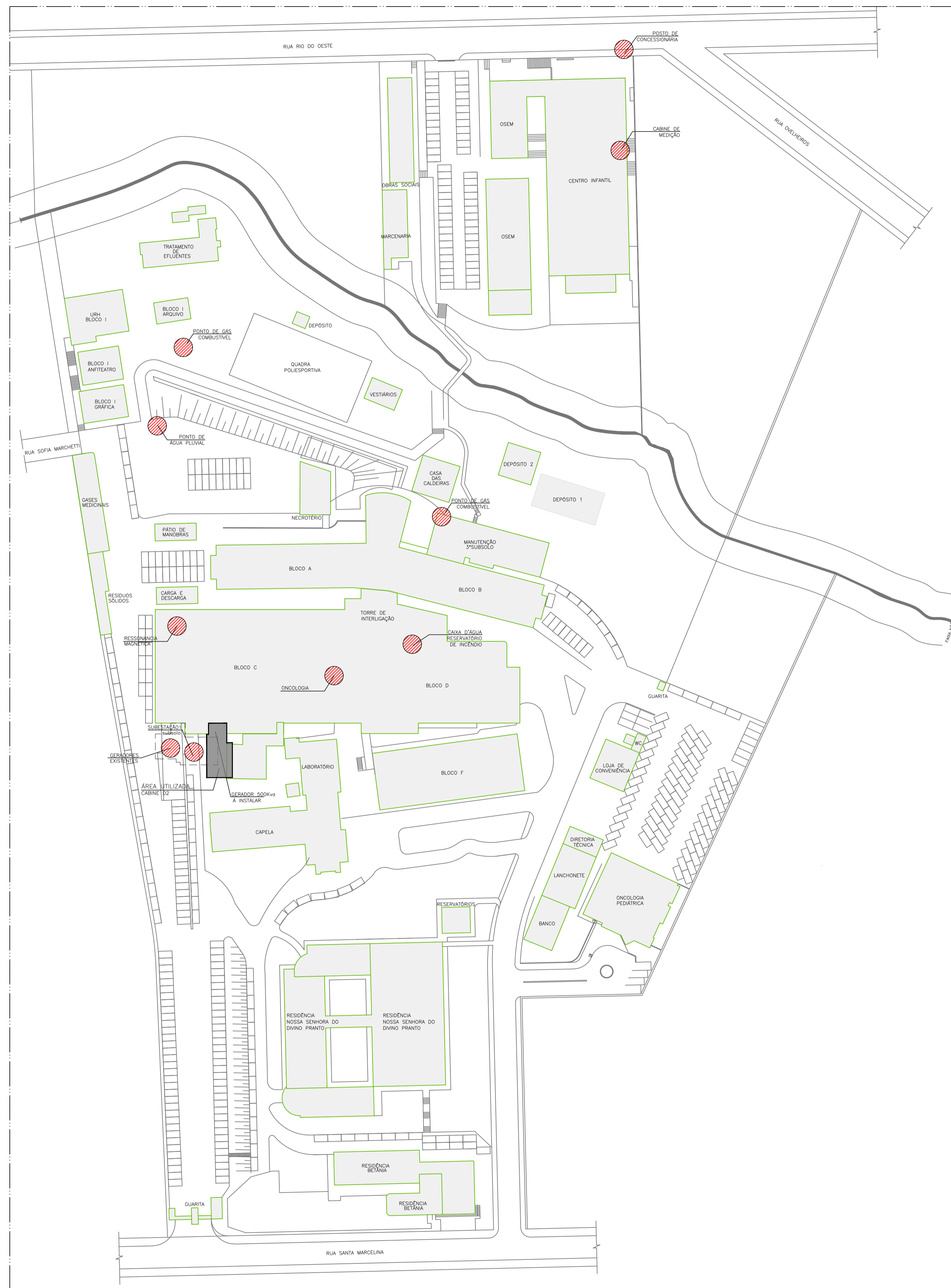
COMPLEXO HOSPITALAR IMPLANTAÇÃO - ESCALA 1:750